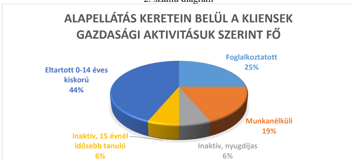
A Család- és Gyermekjóléti Szolgálat adatai alapján saját szerkesztés